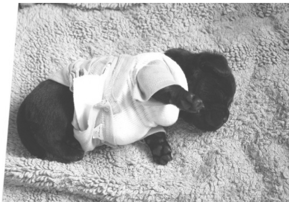
fotografie štěněte v poloze typické pro „plaváčky“ a štěně v „krunýři“